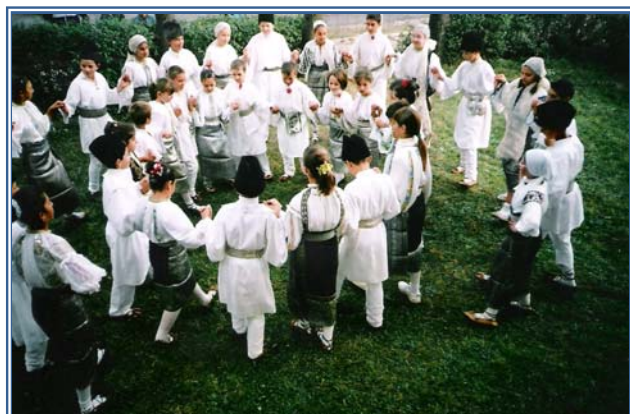
Horă, cu copii în port național (Soveja, jud. Vrancea)

Tot ceea ce înfăptuiește omul se modulează după împrejurările istorice. Caracteristicile unei epoci, atmosfera sau spiritul timpului („Zeitgeist”), influențează chiar și cea mai conservatoare tradiție, generând schimbări contrare acesteia. Modernitatea îndeosebi a bulversat multe dintre manifestările tradiționale. Tensiunea dintre modernitate și tradiție este semnificativă în privința dependenței inovațiilor de spiritul timpului. Ideea de inovație intră în esența conceptului de modernitate. În această dispută, tradiția rezistă dacă manifestările ce o compun izbutesc să-și păstreze structura și funcțiile. Un caz interesant este acela al portului nostru popular: el a decăzut sub acțiunea iradiantă a industriei textile moderne, mai productivă și mai confortabilă decât industria