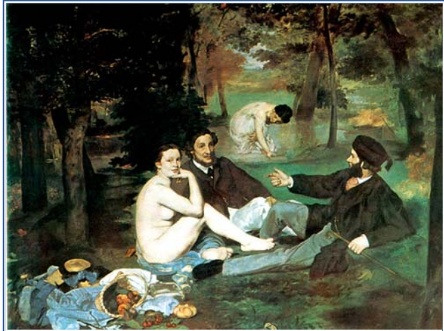
Edouard Manet, Dejun pe iarbă (1863)